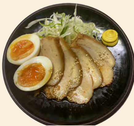
とろとろチャーシュー盛り合わせ (4枚入)