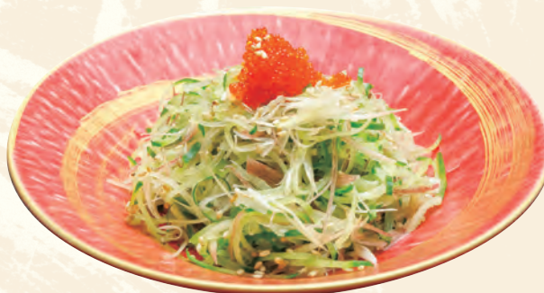
シャキシャキみょうがきゅうり