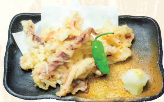
いか一夜干し天ぷら