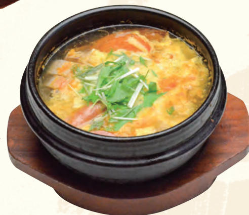
イタリアントマト鍋