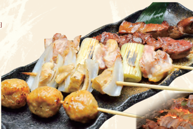
串焼き 5 種盛り合わせ