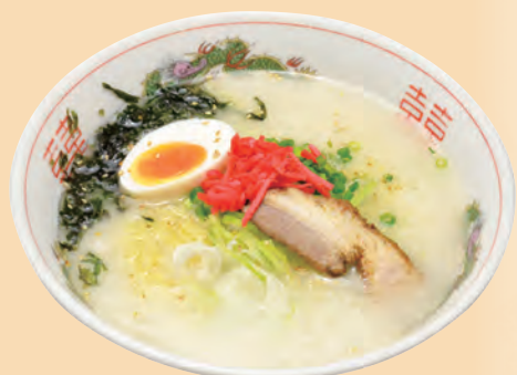
豚骨ラーメン 味噌 1,450円 醤油 1,400円 塩 1,350円