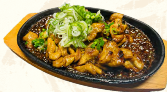
昔なつかし 焼もつ鉄板焼き