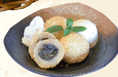
ごま団子 バニラアイス添え