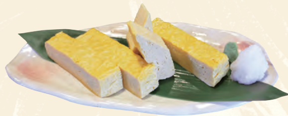
辨慶のだし巻き玉子