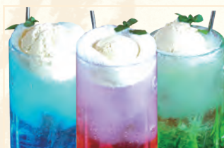
各クリームソーダ