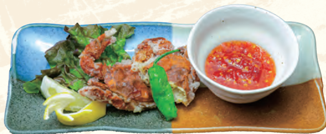
丸ごと渡り蟹の唐揚げ (スイートチリソース添え)