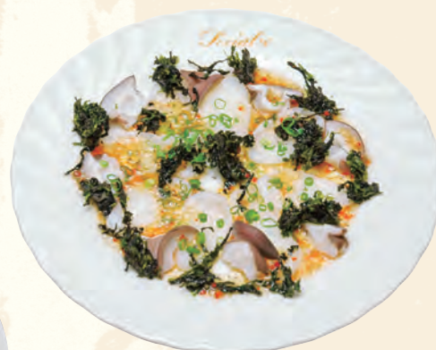
岩のり&たこのカルパッチョ