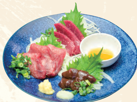
馬刺 3 点盛り合わせ