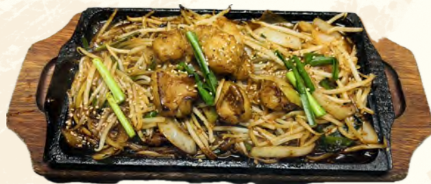
牛ホルモン鉄板焼き