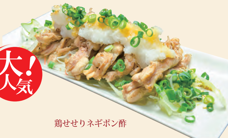
鶏せせりネギポン酢