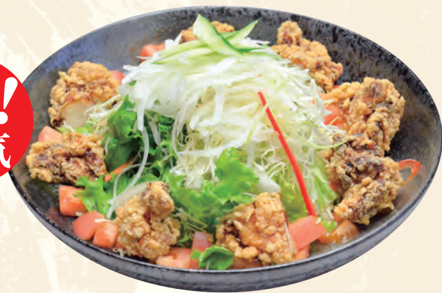
鶏の唐揚げサラダ