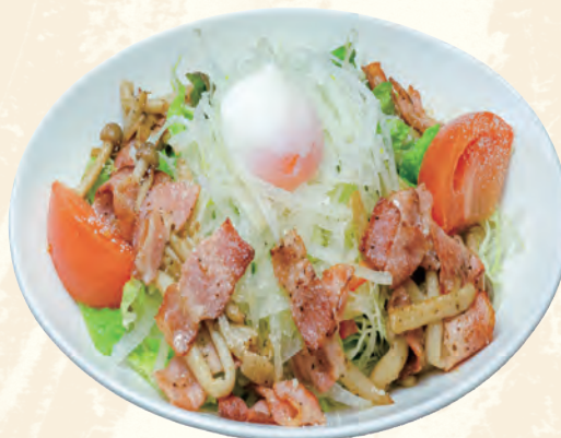
ベーコンときのこの温玉サラダ