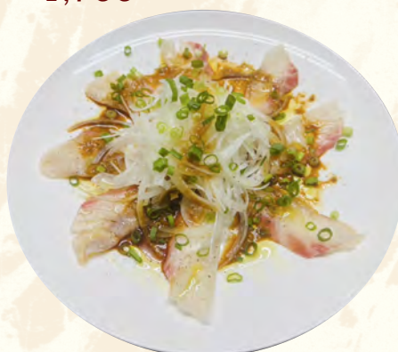
鯛の和風カルパッチョ