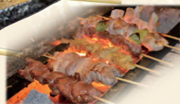
炭火でじっくり焼き上げます